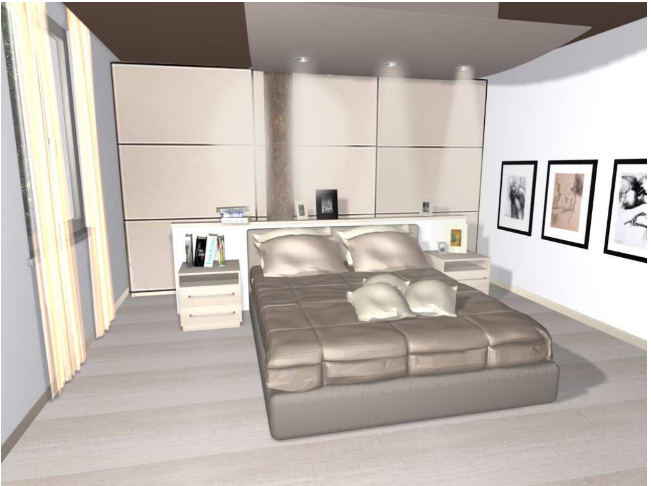
Render della camera